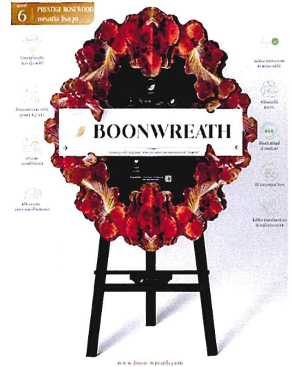
Prestige Rosewood (พ레스ทิจ โรสวูด) ฿2,200.00