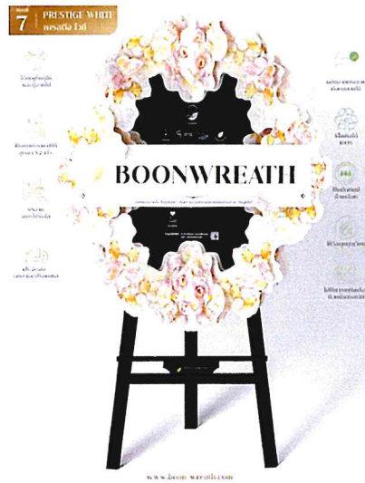
Prestige White (พ레스ทิจ ไวท์) ฿2,500.00