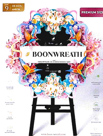
HEAVEN (เทพเวเน) ฿8,500.00