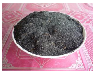
ซีอิ๊วแกลบดำ