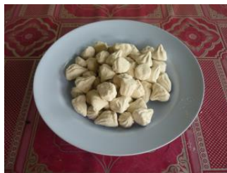
ดินสอพอง